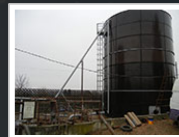
Kompletní oprava močůvkové nádrže včetně zastřešení