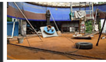
Průběh kompletní generální opravy nádrže pro ČOV.