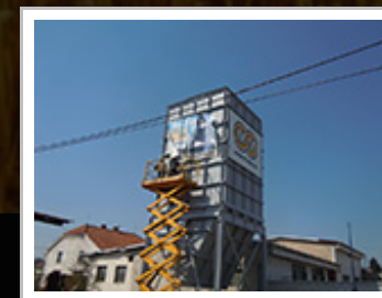
Montáž hranatého zásobníku ve Slavíči.