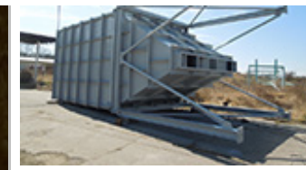
Renovovaný kovový zásobník připravený na montáž.