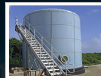
Smaltovaná požární nádrž.