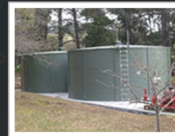
Smaltovaná požární nádrž.