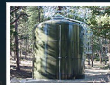
Smaltovaná požární nádrž.