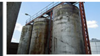
Smaltované nádrže v areálu Glycony.

Pro stažení stránky ve formátu PDF klikněte na ODKAZ