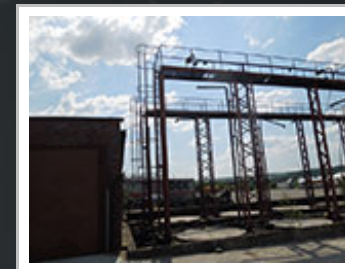
Kompletní demontáž smaltovaných nádrží.